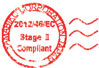
Silnik o niskiej emisji spalin zgodny z normą Stage 2 oznacza obniżoną emisję spalin