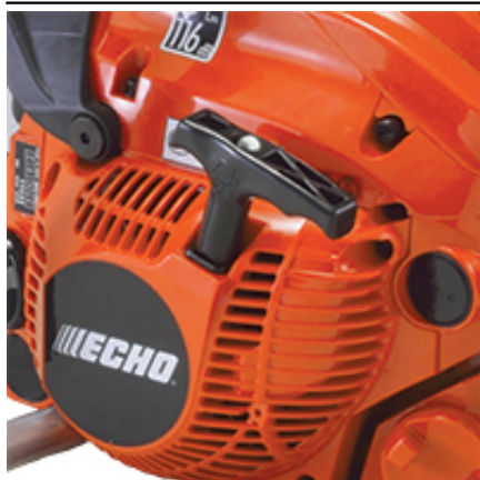
Silnik ECHO klasy premium