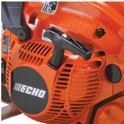
Silnik ECHO klasy premium

Technologie Echo / Shindaiwa / Yamabiko zastosowane w tym modelu