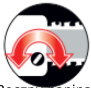
Boczny napinacz łańcucha