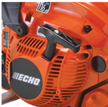
Silnik ECHO klasy premium