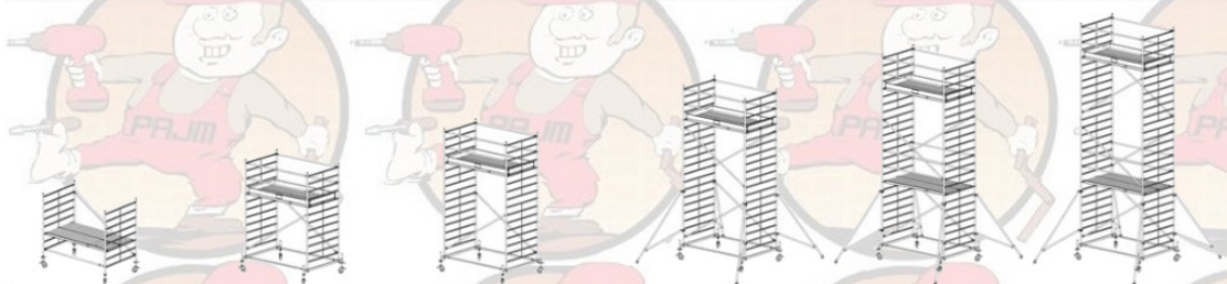
Wys. robocza: 3,00 m Wys. rusztowania: 2,30 m Wys. pomostu: 1,00 m Wys. robocza: 4,40 m Wys. rusztowania: 3,40 m Wys. pomostu: 2,40 m Wys. robocza: 5,40 m Wys. rusztowania: 4,40 m Wys. pomostu: 3,40 m Wys. robocza: 6,40 m Wys. rusztowania: 5,40 m Wys. pomostu: 4,40 m Wys. robocza: 7,40 m Wys. rusztowania: 6,40 m Wys. pomostu: 5,40 m Wys. robocza: 8,40 m Wys. rusztowania: 7,40 m Wys. pomostu: 6,40 m