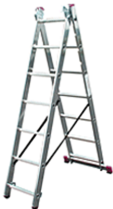
Zastosowanie jako drabina dwuczęściowa wolnostojąca

Wysokość robocza sięga 5,40m! Dzięki zastosowaniu wytrzymałych profili aluminiowych drabina pozostaje sztywna i stabilna!