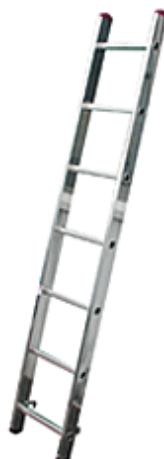
Zastosowanie jako drabina jednoczęściowa przystawna