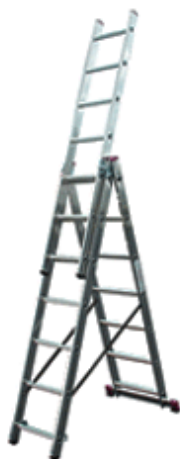
Zastosowanie jako drabina trzyczęściowa wolnostojąca